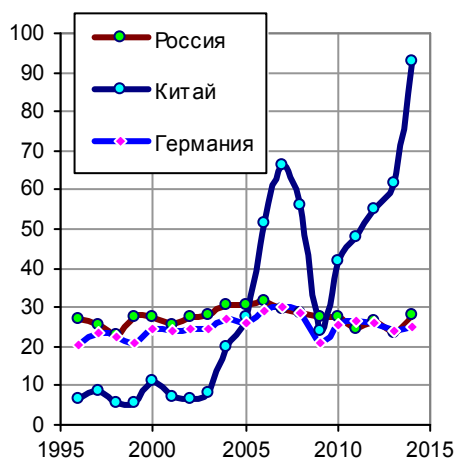
Экспорт стали (semi-finished and finished steel products), млн. тонн.