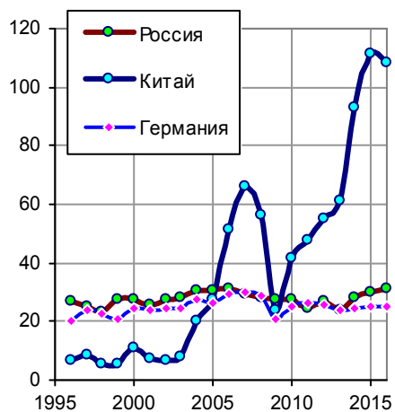
Экспорт стали (semi-finished and finished steel products), млн. тонн.