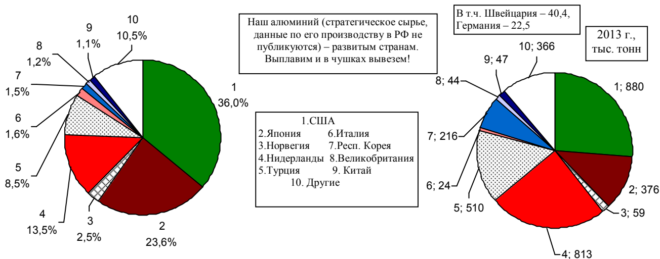
Рис. 1.117. Основные импортеры российского алюминия.

Дополнительную информацию и ссылки на источники см. в книге «Российские реформы в цифрах и фактах» на сайте http://refru.ru