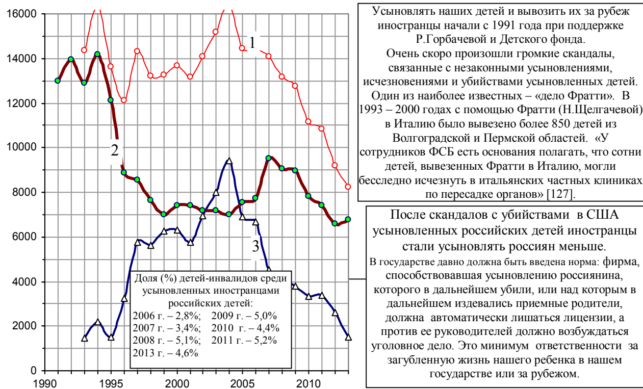
Рис. 2.120. Количество ежегодно усыновляемых российских детей (1), в том числе усыновленных российскими (2) и иностранными (3) гражданами. При построении графика использованы данные [1.6], Национального статистического комитета Республики Беларусь, материалы Минобрнауки РФ и интернет-проекта Минобрнауки РФ «Усыновление в России», www.usynovite.ru .

За 21 год (1993 – 2013 гг.) за рубеж вывезено около 100 тысяч ненужных государству российских детей. Для сравнения: за 4 года, с 2005 г. по 2008 г., из Республики Беларусь иностранцы вывезли четырех усыновленных белорусских детей.