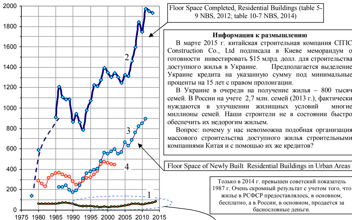
Рис. 1.216. Строительство жилья в России (1), в Китае (городское и сельское жилье - линия 2, только городское – линия 3) и в США (4), млн. м 2 в год (для США – площадь жилья по заключенным контрактам). Источники: [I.6, I.57]; U.S. Census Bureau; National Bureau of Statistics of China.