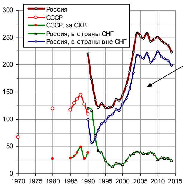
Рис. 1.102, а. Экспорт сырой нефти СССР (в т.ч. за свободно конвертируемую валюту, СКВ) и РФ, млн. т. Источники: [1.3, 1.6]; ЦБ РФ.

С чем связан этот значительный рост объемов экспорта? Напечатано много долларов и появились евро? И почему не собираем тугрики, кванзы, квачи, пулы, воны, баты, риалы, дирхамы, рупии, кьяты, таки, добры, леи, нгултрумы, донги, кипы, рупии, сомы, сумы, седи, манаты, даласи, угии, найры, эмалангени, малоти, метикалы и др. – они тоже очень красивые.