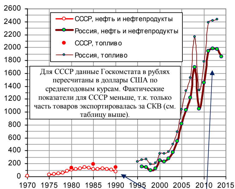
Рис. 1.559. Экспорт нефти, нефтепродуктов и топливных ресурсов на душу населения в СССР и в РФ, долл.