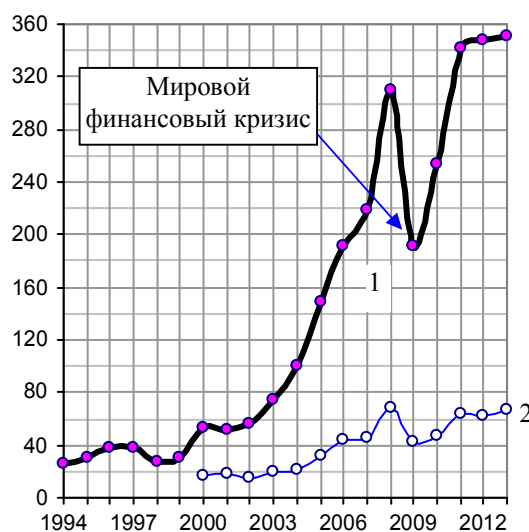
Рис. 1.560. Экспорт из России сырой нефти, нефтепродуктов и природного газа (1), в том числе газа (2), млрд. долл.

Отметим также, что экономика Китая будет успешно развиваться и при цене нефти 150 долларов за баррель, и, еще успешнее, - при цене 0 долларов за баррель. Видимо, они хорошо думали, прежде чем что-то реформировать.