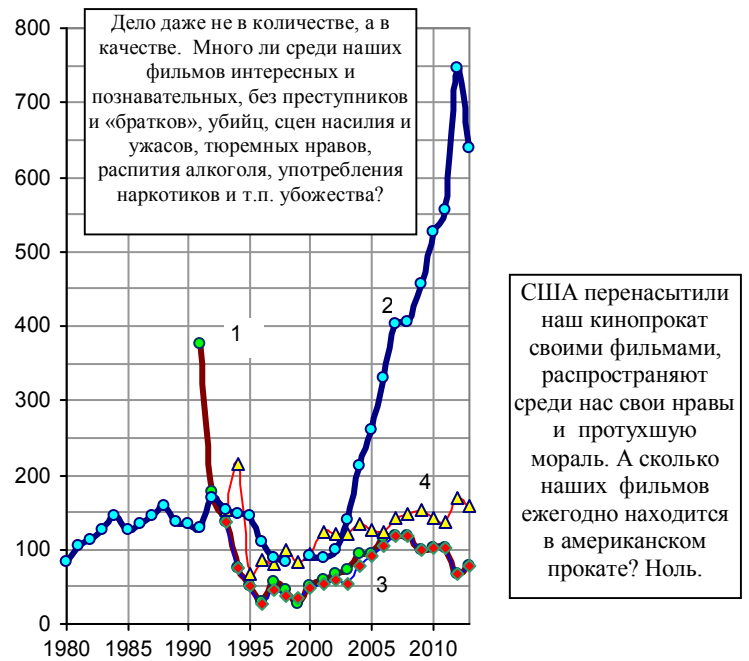
Рис. 7.11, б. Выпуск художественных фильмов в России (1) и в Китае (2), выпуск российских фильмов (3) и фильмов США (4) на экраны (в прокат) России.