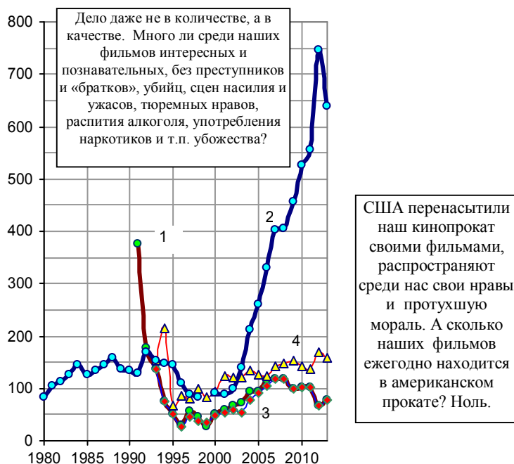
Рис. 7.11, б. Выпуск художественных фильмов в России (1) и в Китае (2), выпуск российских фильмов (3) и фильмов США (4) на экраны (в прокат) России.