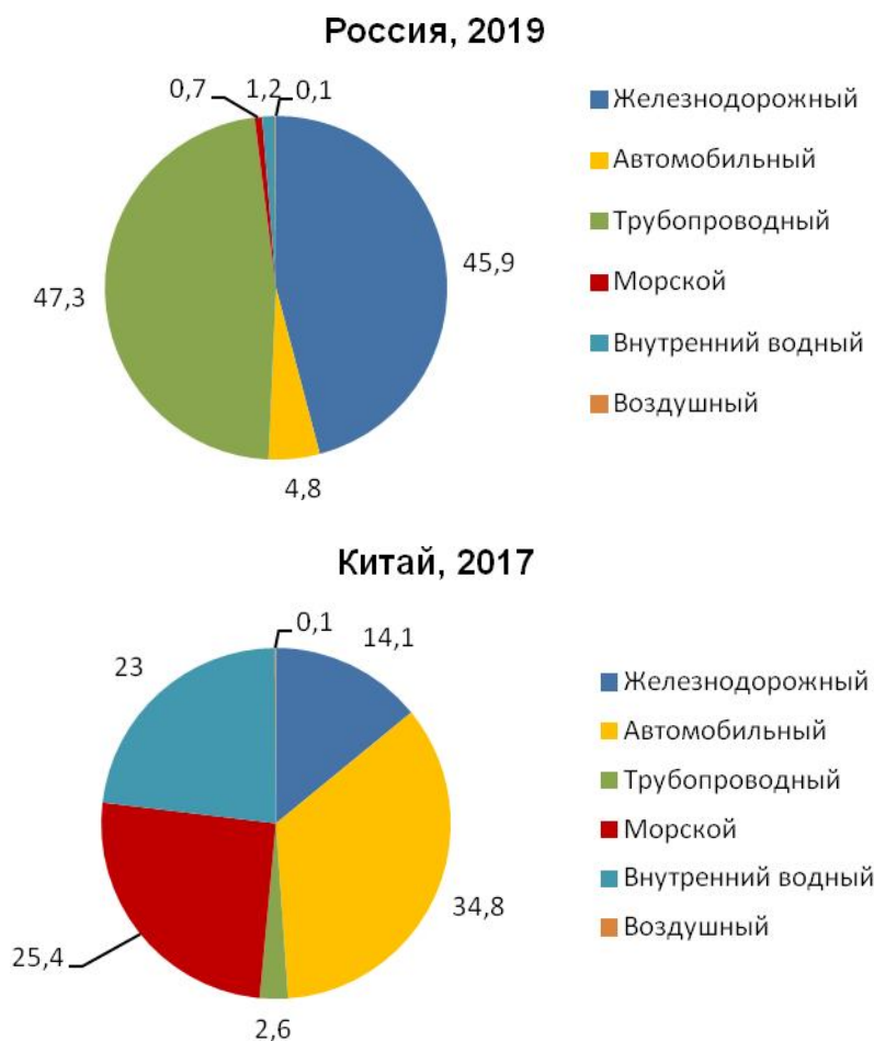
Рис. 1.243, б. Удельный вес отдельных видов транспорта в общем грузообороте в России и Китае, проценты (расчет по данным в т*км). Источники: [1.6], China Statistical Yearbook.

В Китае преобладают перевозки грузов автомобильным, морским и внутренним водным транспортом.