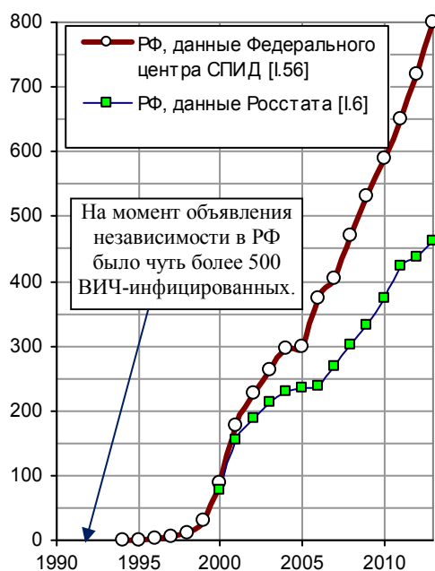
Рис. 3.28, а. Зарегистрировано больных ВИЧ-инфекцией по данным Росстата [I.6]; количество ВИЧ-инфицированных россиян по данным Федерального центра СПИД, кумулятивные данные на конец года (суммарное количество зарегистрированных с даты начала регистрации) [I.56], тыс. чел.