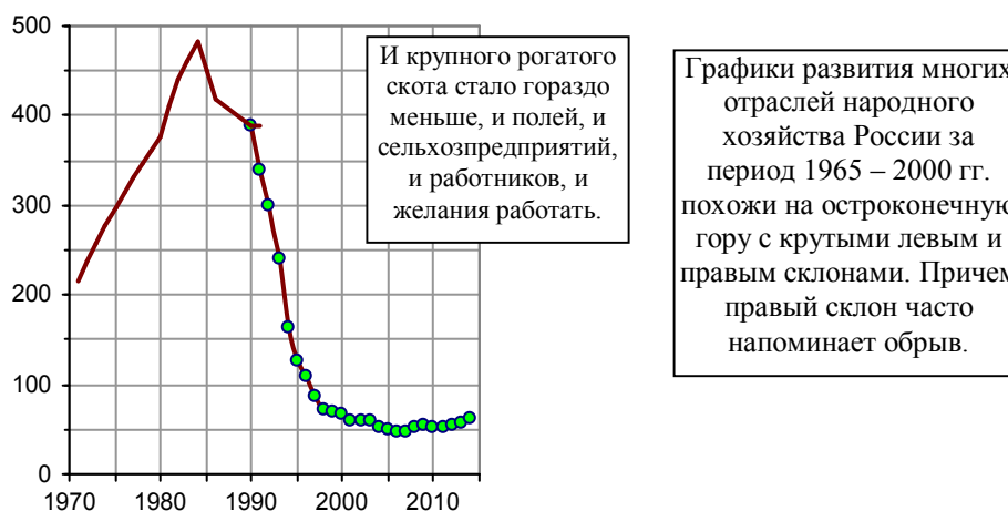
Рис. 1.316. Внесение органических удобрений под посевы в сельхозпредприятиях России, млн. т. Источники: [I.6, I.7].