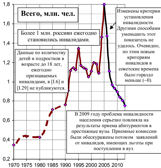
Рис. 3.53, а. Численность лиц, впервые признанных инвалидами (до 2000 г. - в возрасте 16 лет и старше, с 2000 г. - в возрасте 18 лет и старше), млн. чел.