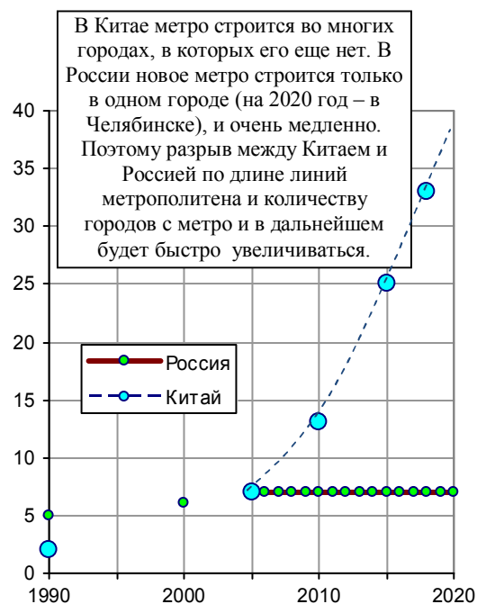
Рис. 1.266, в. Количество городов в России и Китае, имеющих метро.

Дополнительную информацию и ссылки на источники см. в книге «Российские реформы в цифрах и фактах» на сайте http://refru.ru