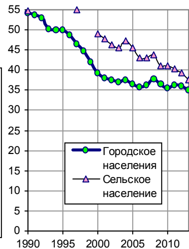
Рис. 4.27, б. Отношение расходов на питание к общей сумме потребительских расходов домашних хозяйств (коэффициент Энгеля).

Дополнительную информацию и ссылки на источники см. в книге «Российские реформы в цифрах и фактах» на сайте http://refru.ru