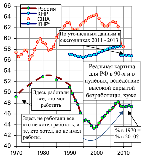
Рис. 1.44, б. Количество занятых в экономике США (all civilian workers) в процентах от численности населения; среднегодовая численность занятых в экономике России и Китая в процентах от численности населения в этих странах. Источники: расчеты по [I.6, I.7] и National Bureau of Statistics of China; Economic Report of the President, 2011, table B-39.

Следует учесть также разную интенсивность и эффективность труда на американских, китайских и российских предприятиях и в сельском хозяйстве.