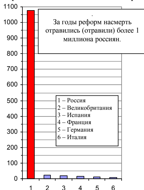
Рис. 2.48, б. Суммарное количество погибших от случайных отравлений за период 1992 – 2010 гг., тысяч.