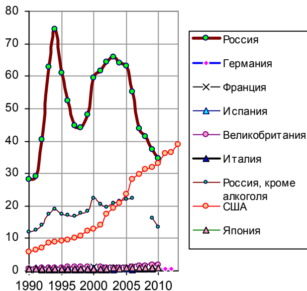
Рис. 2.48, а. Количество погибших от случайных отравлений, тысяч человек.

Конечно, основная роль в гибели россиян по этой причине принадлежит алкоголю. Но смертность и от другой отравы в нашей стране несравнима с показателями в развитых странах (рис. 2.48). Что едим?