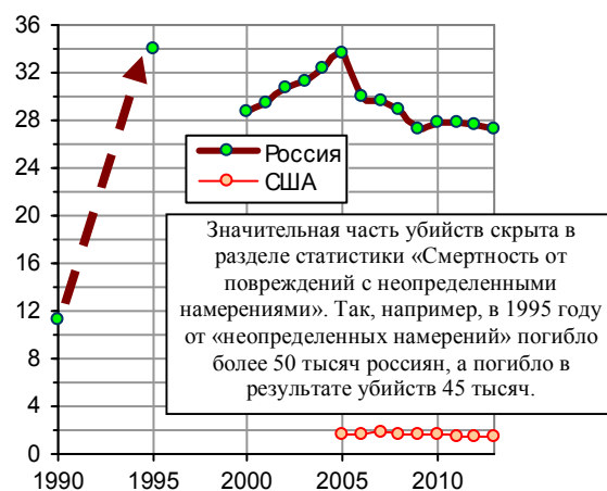
Рис. 2.51. Смертность от повреждений с неопределенными намерениями, на 100 тыс. человек.

Дополнительную информацию и ссылки на источники см. в книге «Российские реформы в цифрах и фактах» на сайте http://refru.ru