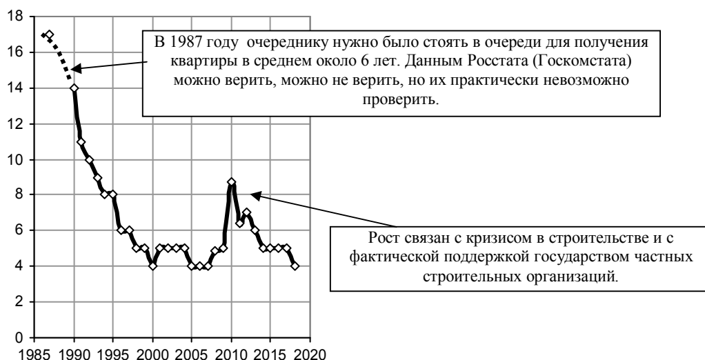
Рис. 1.231. Число семей (включая одиночек), получивших жилье и улучшивших жилищные условия, в % от числа семей, состоящих на учете на получение жилья. Источник: [1.6].