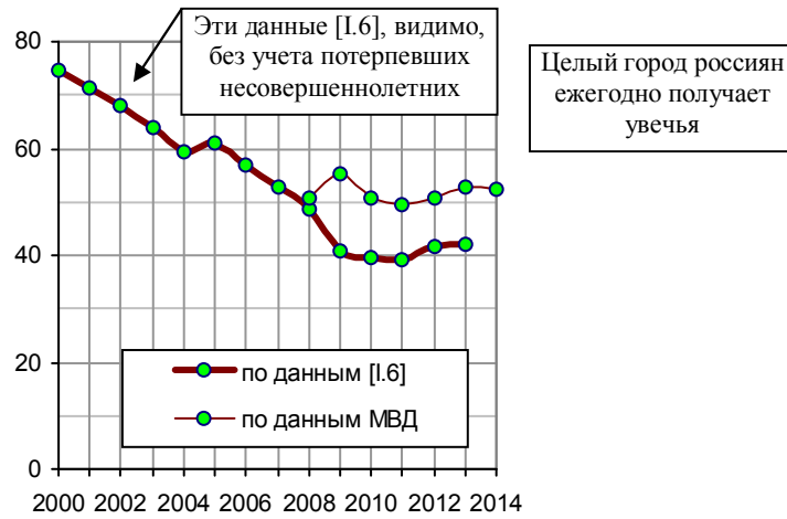
Рис. 6.11, в. Количество лиц (мужчин и женщин), получивших тяжкий вред здоровью в результате преступных посягательств по данным [1.6], тысяч; количество лиц, которым причинен тяжкий вред здоровью в результате преступных посягательств (на момент возбуждения уголовного дела) по данным МВД, тысяч.

Дополнительную информацию и ссылки на источники см. в книге «Российские реформы в цифрах и фактах» на сайтах http://refru.ru и http://kaivg.narod.ru