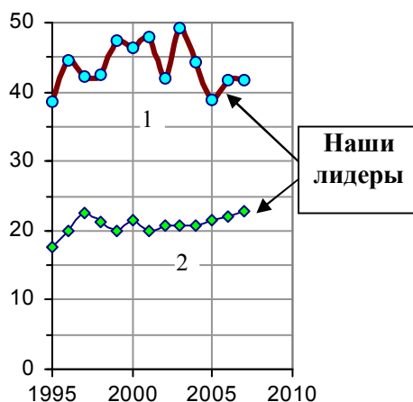
Рис. 4.17. Коэффициент фондов в Москве (1) и в Тюменской области (2).

Сравнить доходы богатых и бедных при распределении населения по 20-процентным группам можно по рис. 4.18.